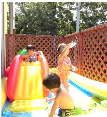
↑ おすべり台付きプールは バルンダで★眺めはサイコー!!