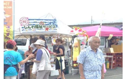
↑松崎町『海のピカ市』にて