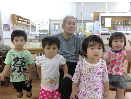
↑ 敬老の記念撮影♪ 利用者さんも自然と笑顔です♪